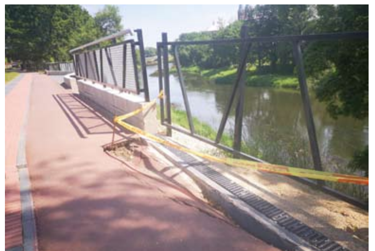
Darbu kaina siekė 1 mln. 89 tūkst. Eur, tačiau jau pernai, pastebėjus projekto darbų broką, jam skirti papildomi 100 tūkst. eurų. Taip dabar atrodo dešiniojo Šventosios kranto takas, kuris eksplotacijai pridurtas tik praėjusių metų pabaigoje.