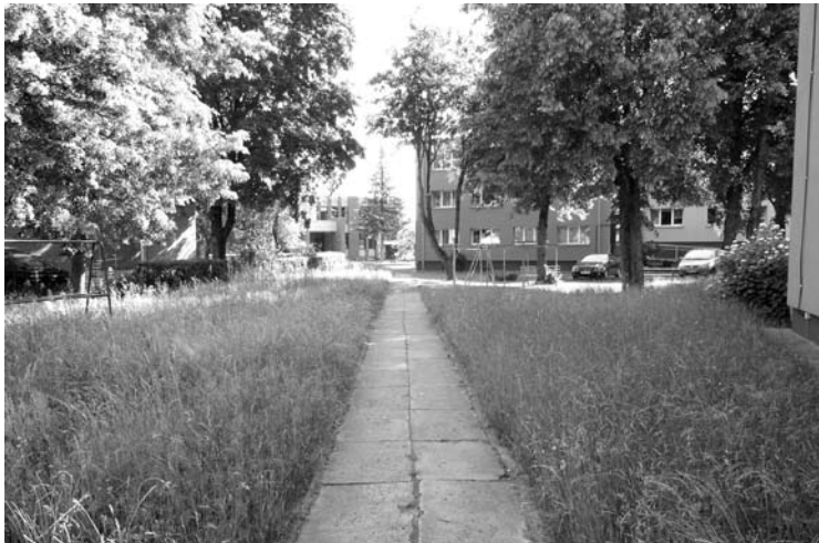
V.Kudirkos gatvės gyventojai „Anykštos“ žurnalistą pakvietė užsukti į šios gatvės daugiabučių kiemus, o juose kai kur žolė nelyginant pievoje.