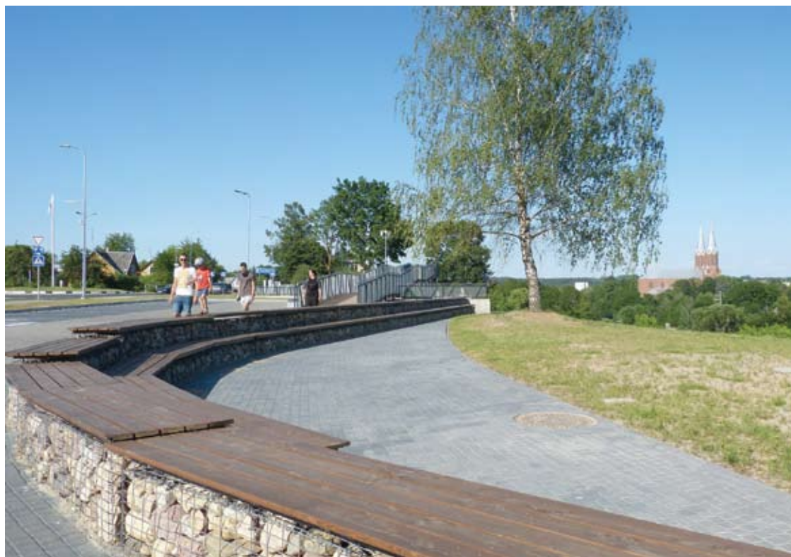
Dešinysis Šventosios takas pakeitė miesto vaizdą ties įvažiavimu į Anykščius.

Robertas ALEKSIEJŪNAS robertas.a@anyksta.lt