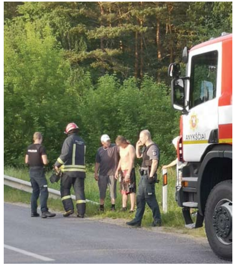
Dėl „skenduolio“, kuris galų gale iš tvenkinio išlipo pats, į Vikonis važiavo keturi specialiųjų tarnybų ekipažai.