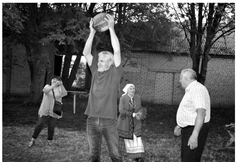
Būta ir įvairių linksmybių konkursų, ir nuotaikingų prizų...