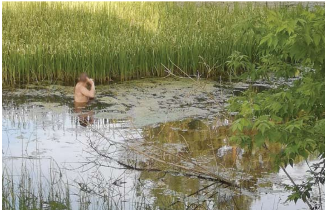
Sprukdamas nuo policijos pareigūnų, Grikiapelių kaimo gyventojas šoko į tvenkinį.

Joninių, birželio 23- iosios, vakarą Vikonių (Svėdasų sen.) tvenkinyje murkdėsi vyras, o nuo kranto jį stebėjo policijos pareigūnai.