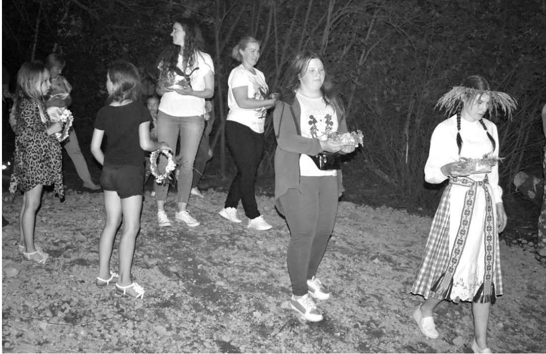
Gėlių vainikėliai tuoj tuoj išplauks išvalyto tvenkinio vandenimis.

Tiesa, kad tas parkas taptų jaukus ir tinkamas masiniams renginiams organizuoti, prirėkė aplinkos tvarkymo tarybų, kuriose aktyviai dalyvavo Vaižganto krašto bendruomenės nariai.