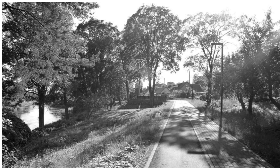
Atsiradus šiam takui, Žvejų gatvės gyventojai prarado privačius paplūdimius.

„Valdžia nesugebėjo padaryti tinkamo projekto pristatymo, jį nepakankamai paviešino. Kai komisijos vaikščiojo dar prieš pradėdamus darbus, tai aš buvau vienas iš tų, kuris komisiją vaikėsi fiziškai. Komisija praeina darbo dienos metu, per pietų pertrauką. Ką jie tokiu metu gali rasti Žvejų gatvėje? Bobutė 90-ties metų. Visi juk dirba. Skelbimai, kad dėl projekto reikia susirinkti, buvo dviejose Žvejų gatvės vietose pakabinoti prie tvoros. Kita vertus, nebuvo tokios patirties ir niekas neįsivaizdavo, kad mokinti žmonės - specialistai, architektai, gamtosaugininkai - padarys