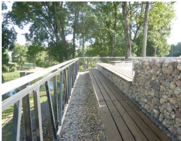
Tako sprendinius architektai vertina kaip agresyvią invaziją į Anykščių landšaftą.